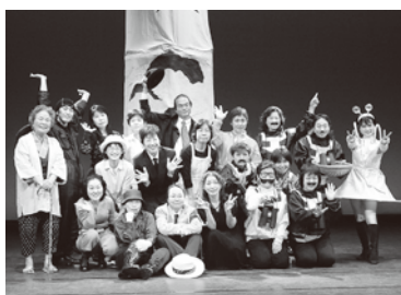
アクテノン シニア演劇部公演 「いっぽんのキ」 '06年12月15日～16日 中村文化小劇場にて